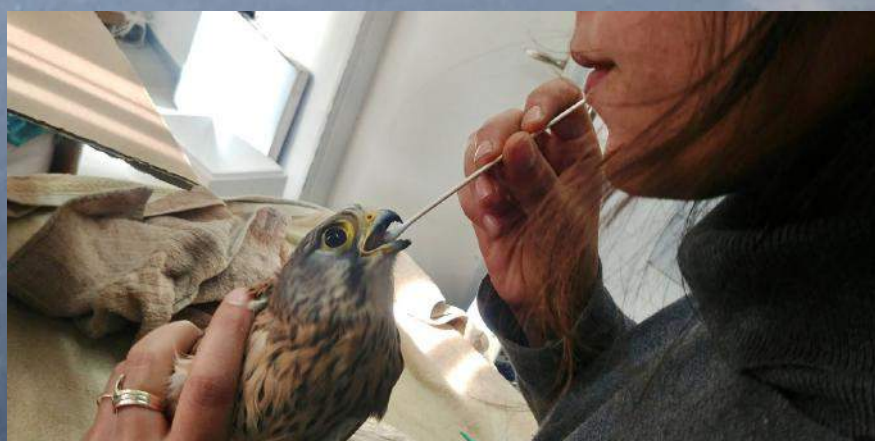
האכלת בז מצוי