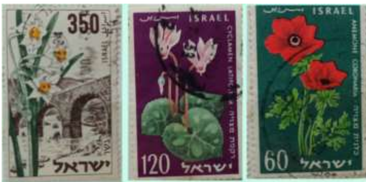
בולי פרחים שיצאו לרגל יום העצמאות תשי"ט 1959

הפרי מקובץ, והוא כולל כמה מאות זרעים, כל זרע מצוייד בעטיפה צמרית דלילה, המאפשרת הפצה יעילה למרחק ניכר בעזרת רוח. הכלנית האדומה נפוצה בארץ בכל חלקיה, ורק בצפון (ומעט מאוד גם במרכז) יש כלניות בכל הצבעים.