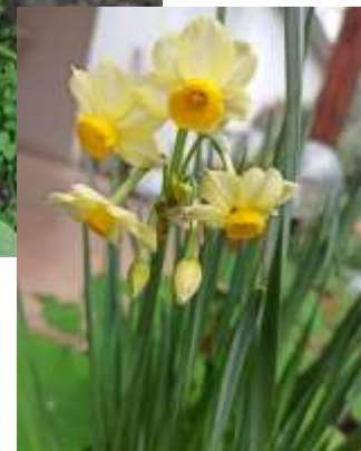
נרקיס בגינה שלי