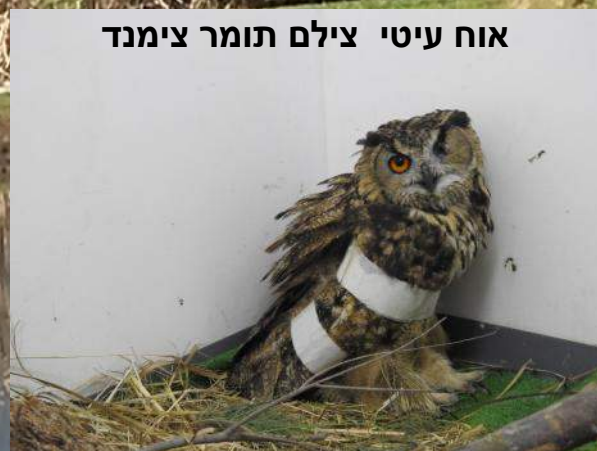
אוח עיטי