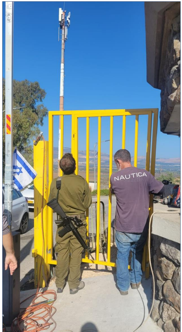
שדרוג שער הכניסה לשמיר

בנוסף לכך הוגדלה קיבולת הסולר בשלושת הגנרטורים של הקיבוץ, והוצאנו מכרז לרכישת גנרטור רביעי שימוקם בשכונות הבזלת והכרם ויחבור למערכת החשמל של חברת החשמל.