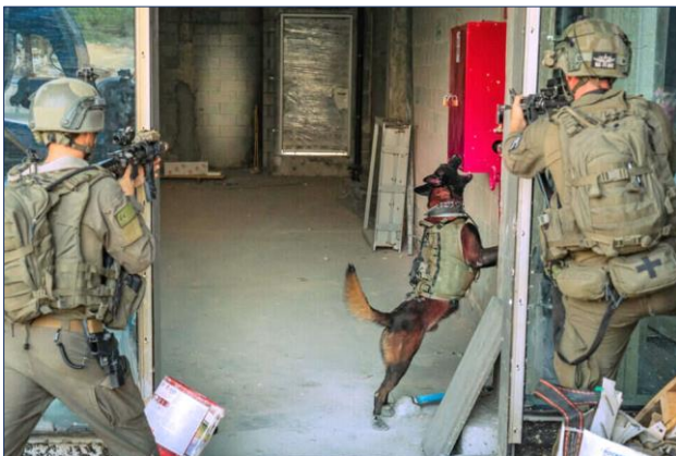
לוחמי "עוקץ" בשטח. צילום מהכתבה ב"ישראל היום"

לאחר החזקת כוננות ביישובי העוטף, פלג חזר עכשיו ליחידה, לסיים את ההכשרה עם הכלב המצוות לו. יחד עם המשפחה אנחנו שולחים לו מכאן חיבוקים ואיחולים שישמור על עצמו ויגיע הביתה בקרוב. ליבנו איתך ועם חבריך.