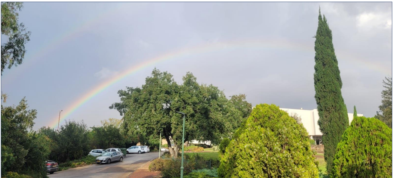
רגע של קשת בענן בשמיר בראשית השבוע.