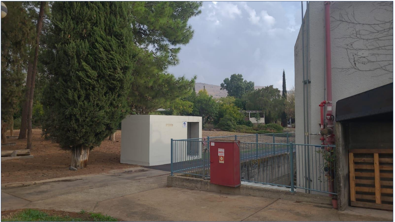
מיגונית חדשה, אחת מכמה שהוצבו בשמיר השבוע.