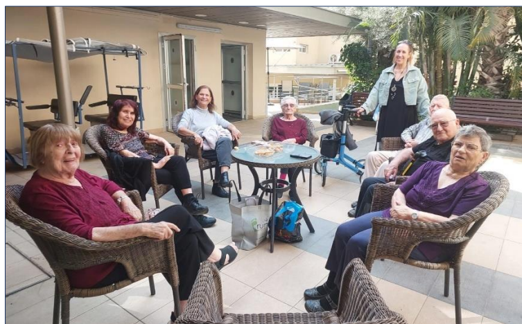
ביקור של צוות הגיל השלישי בהתנחלות השמירית בחיפה