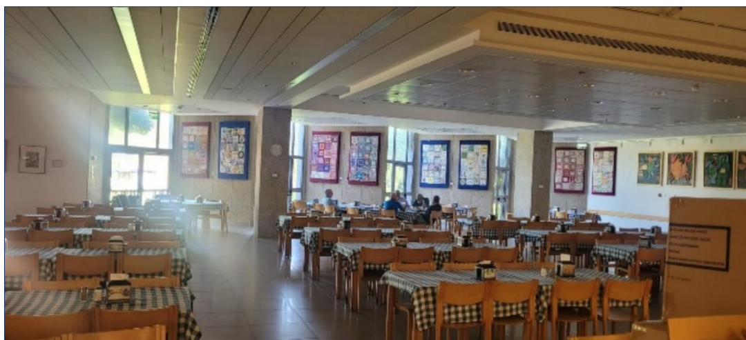
יש מסורות שאפילו נסראללה לא יכול להכחיד. הפרלמנט מתכנס בחדר האוכל.

עוד שבוע מלחמתי עבר עלינו, ואירועי הימים האחרונים מחזקים את ההשערה שאנו רחוקים מסיום המערכה. לאחר יותר מחודש של נדודים ותזוזות, נראה שמסתמנת שגרה מסוימת אצל מי שנשארו בשמיר וגם אצל מי שהתפזרו ביישובים השונים. המשימה החשובה שלנו, ובראש ובראשונה